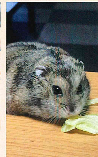
レタスを食べるハムタ♡