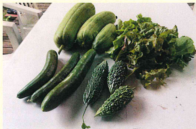
春植えのゴーヤー、ナーベラー、キュウリ、レタス類、もぎたての野菜類

既存の建築物の屋上を緑化する場合は積載荷重の検討が必要です、一般的には180kg/m 2 ですので軽量の人工培土によって植栽基盤を造成することを進めます。